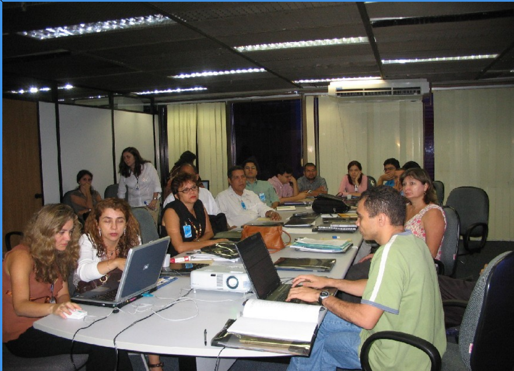
Reunião de trabalho GPDT – Fortaleza/CE ( 2006)